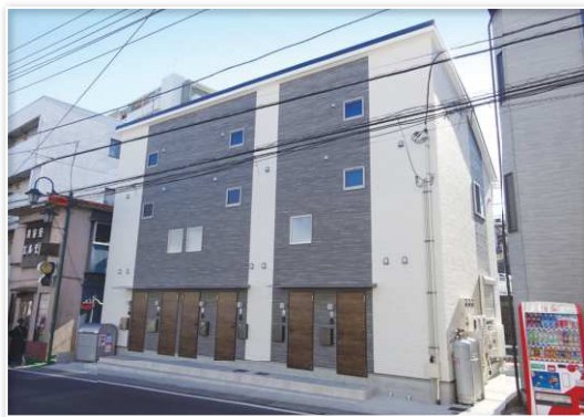
●現地写真(令和2年1月撮影)